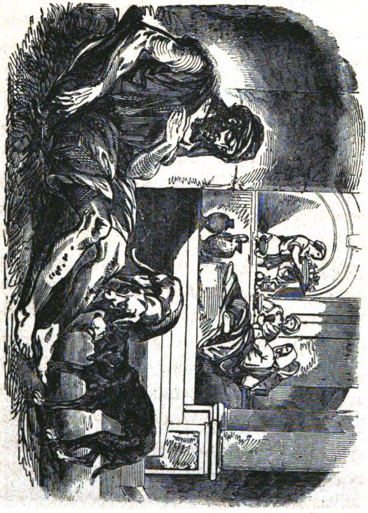
Lazare couvert d'ulcères... p. 54.