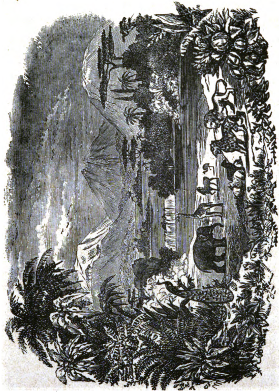
Jusqu'à la création du monde... (p. 9).