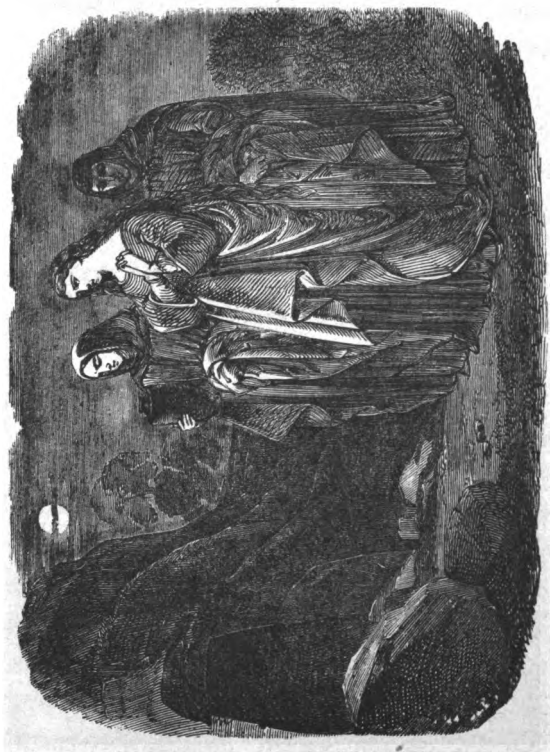
Elles reviennent à l'aube du troisième jour... (p. 214).